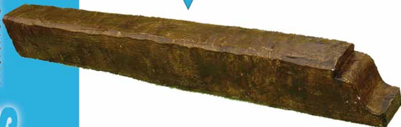
▼ mod. Florencia