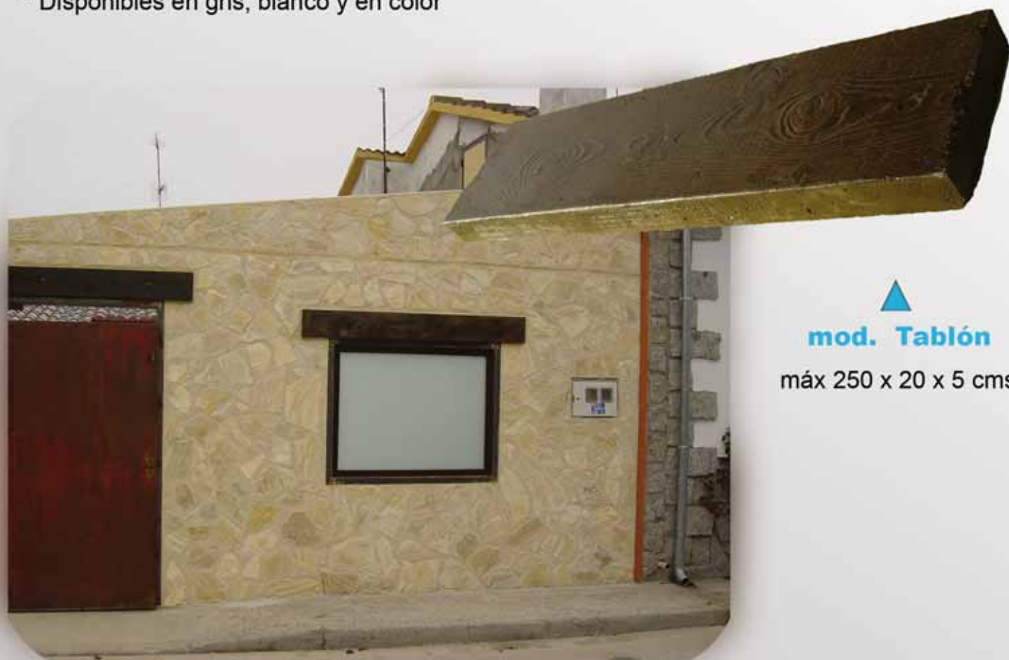
▲ mod. Tablón

* Disponibles en gris, blanco y en color