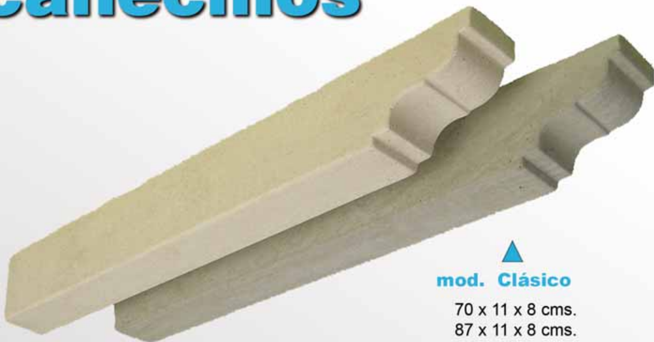
▲ mod. Clásico

70 x 11 x 8 cms. 87 x 11 x 8 cms. 110 x 11 x 8 cms.