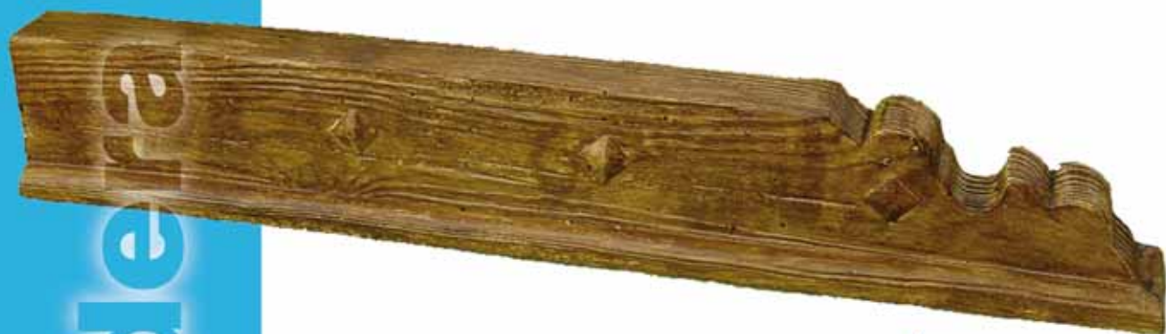
▲ mod. Púas o Clavos